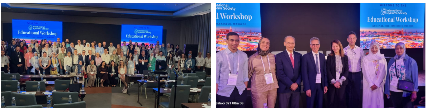
Photos d'un instant fort de la clôture de cet événement mémorable