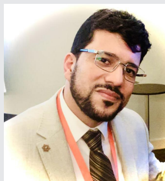
A. Benmoussa Faculté de médecine et de pharmacie - Casablanca

EXCELLENCE ET ENGAGEMENT : VOILÀ CE QUI FAIT GRANDIR NOTRE FAMILLE D'HÉMATOLOGIE !